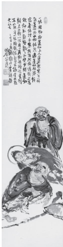
聖者問答図 1924年 89歳