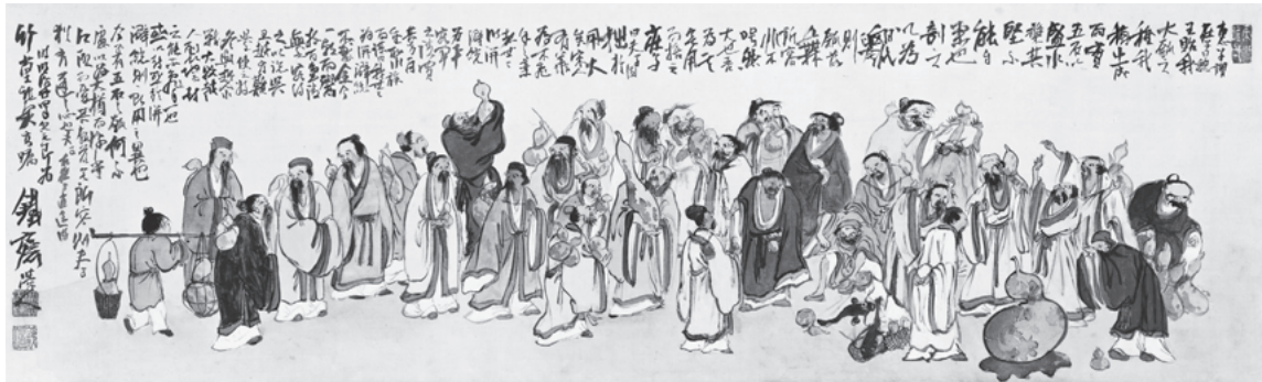
群仙圖 1891年 56歳