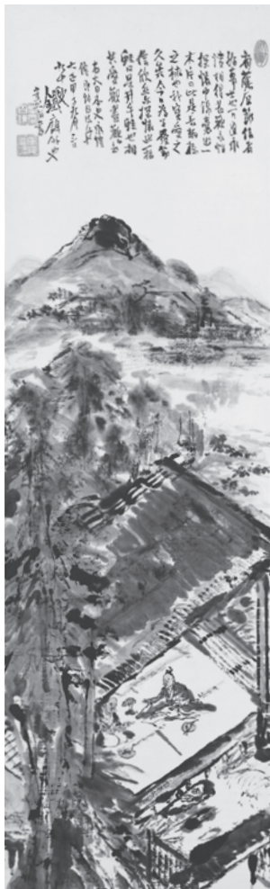
能因法師図 1924年 89歳