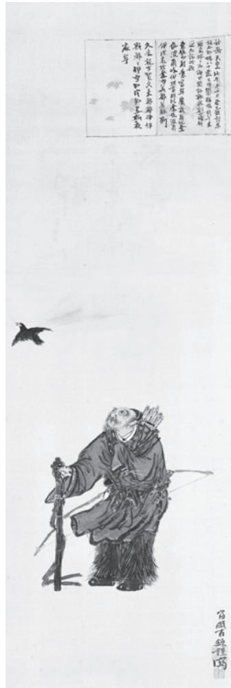
神武天皇像 明治時代 50歳代