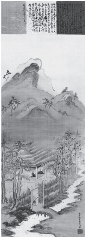
楠妣庵図 1894年 59歳