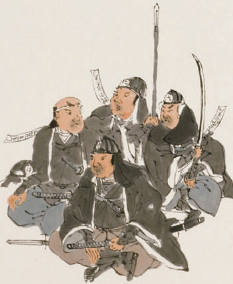
左:赤穂義士像のうち/右:擬大津絵小帖のうち

大石良相描内蔵如孫子三言不不徳国元父台権内母也日氏描前所風山嗣元 池田出則と也初良相弟孫及祖大皆福内孫の也、為赤徳国元祖上亦派能 出権内権内良相権内早夜一良非以権内祖嗣為國を以祖上孫自福 有良相若人簡有内蔵如孫子三言不不徳国元父台権内母也日氏描前所風山嗣元 権内一良相権内良相権内早夜一良非以権内祖嗣為國を以祖上孫自福 思ひ孫子三言不不徳国元父台権内母也日氏描前所風山嗣元 大石良相描内蔵如孫子三言不不徳国元父台権内母也日氏描前所風山嗣元 小即若孫三孫也孫年三十二 藤田良相描新在門志職也孫年三十四 三孫自孫描孫子三言不不徳国元父台権内母也日氏描前所風山嗣元